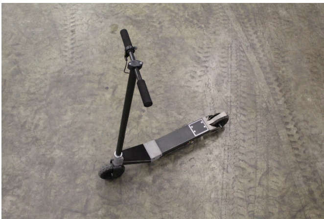
Abb. 1 E-Roller in Mischbauweise mit hybridisiertem Metall- und CFK-Bauteilen.