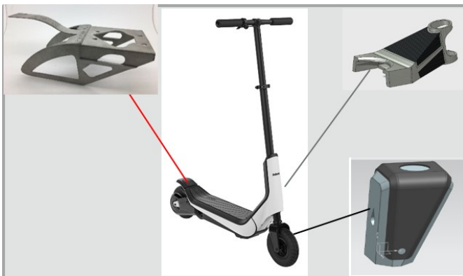
Abb. 2 Visualisierung: Intelligente Verbindungstechniken für CFK und Metall.