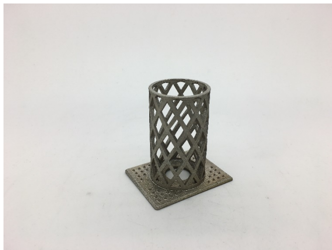
Abb. 4 Laminierhülle mit neuartiger Pinstruktur für die formschlüssige Verbin- dung mit den vorimprägnier- ten CFK-Fasern.